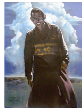
Le nuvole 100cm x 70cm

L'avvio di questo progetto nasce, dunque, dall'incontro tra esigenze diverse e l'interesse dell'Associazione a individuare nuovi modi per promuovere la conoscenza dell'arte contemporanea e le produzioni che giovani riescono a elaborare, nel loro percorso di crescita artistica.