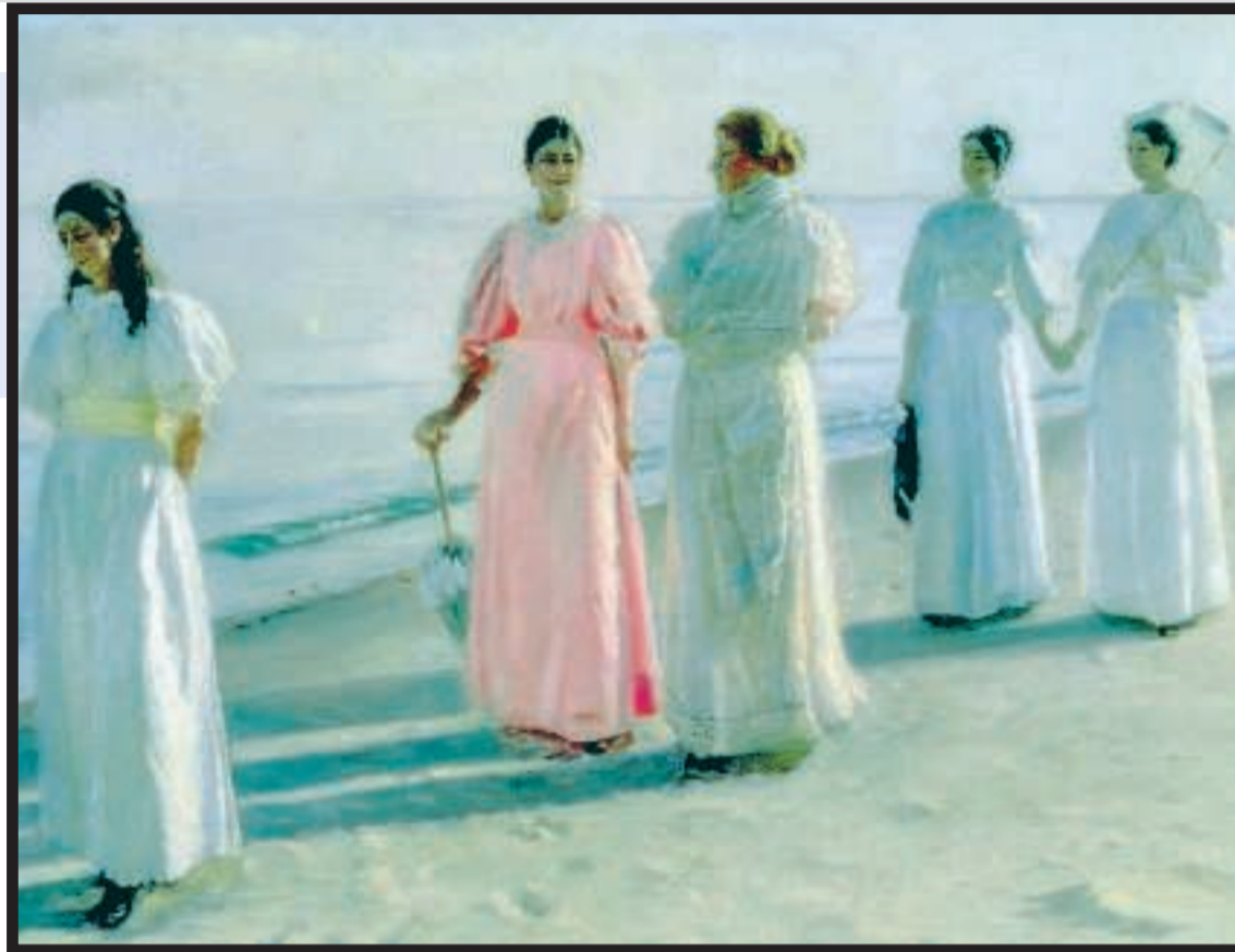
Michael Peter Ancher: "Passeggiata sulla spiaggia" (1896)

Dall'aura mitica degli anni Sessanta al superaffollamento di oggi