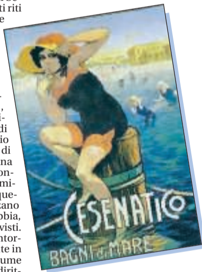
MANIFESTO Una locandina del 1914 pubblicizza gli stabilimenti balneari di Cesenatico, sulla costa adriatica

GIUDIZIO Ci tormentiamo per qualche chilo in più temendo il giudizio del vicino di ombrellone