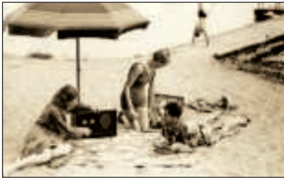
IL BOOM ANNI '50-'70 Il turismo di massa invade le spiagge, che si attrezzano per consentire a tutti il rito della vacanza: nel '59 vanno in vacanza 5 milioni di italiani, 11 nel '65, si arriva a 20 milioni dieci anni dopo